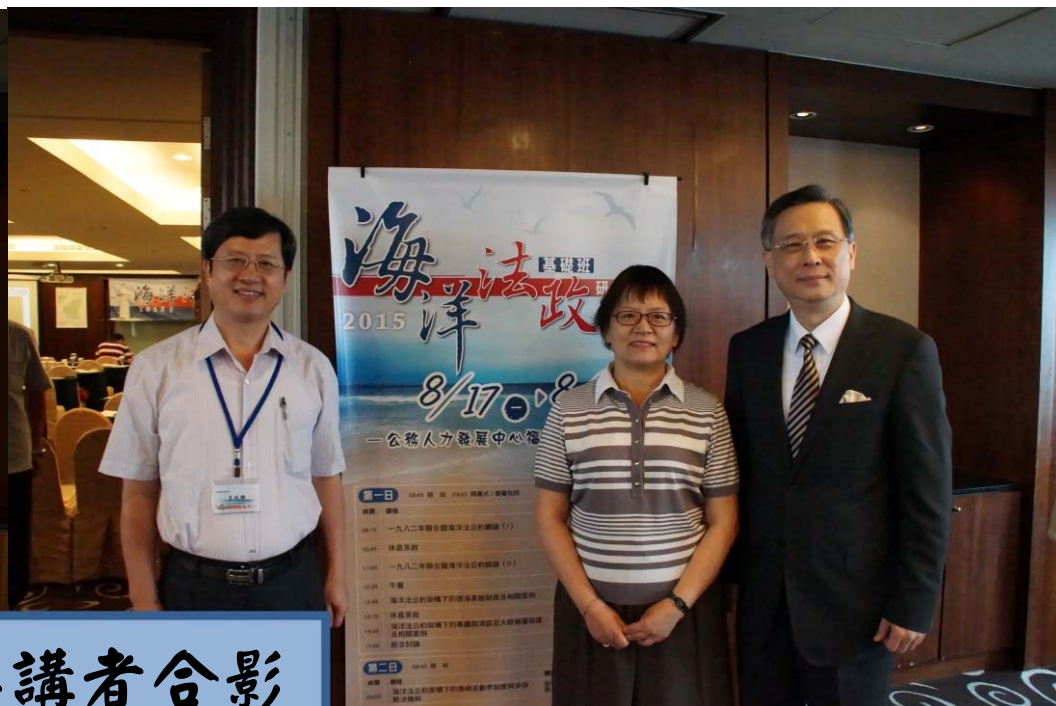
胡主任與講者合影