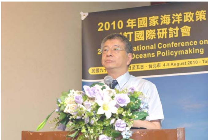
國防部楊念祖副部長發表「國家海洋政策制訂中之海軍利益」