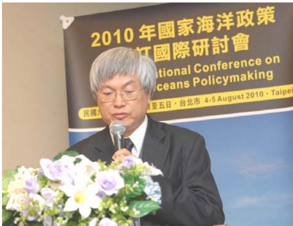
環保署邱文彥副署長發表 「國家海洋政策制訂中之海洋環境保護： 台灣的實例」