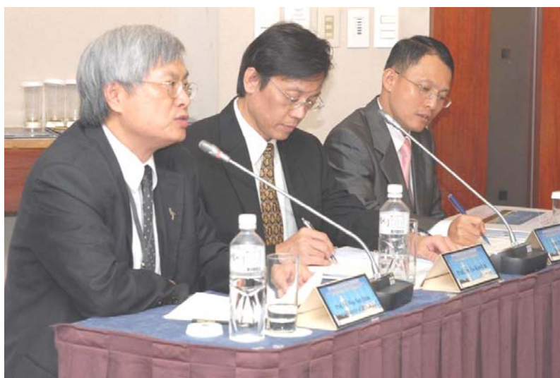
環保署邱文彥副署長 回答問題