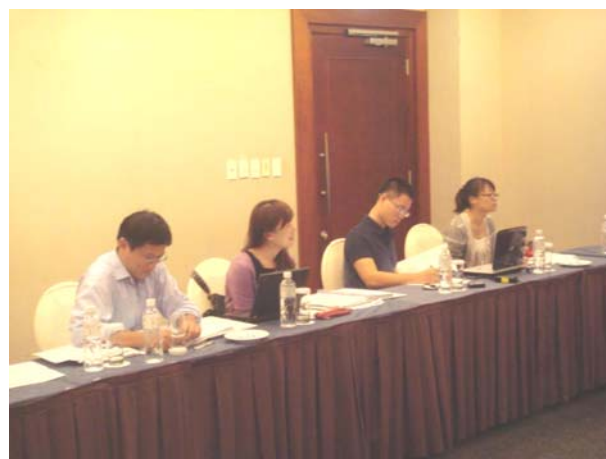
論文發表者與同步口譯人員 討論口譯細節