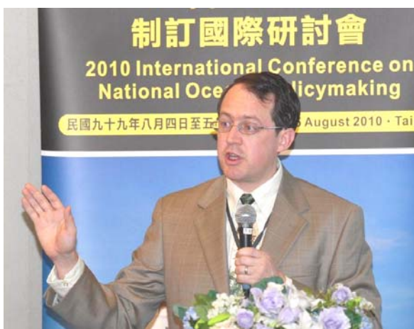
來自澳洲的 Warwick Gullett 教授發表「國家海洋政策制訂中之漁業利益」